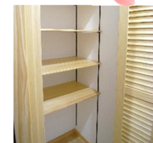
キッチン近くにパントリーを