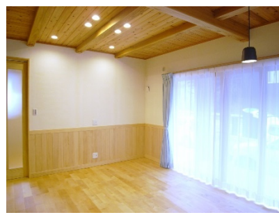
LDK 壁漆喰塗り(カルクウォール) 腰板貼 天井杉板