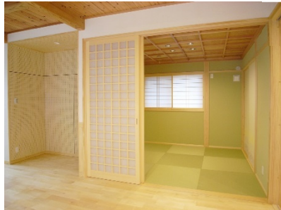
リビング横の和室(格天井・和紙畳) 和室入口横の空スペースはピアノ置場