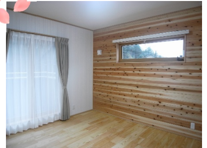
寝室の壁には杉無垢板でアクセントを