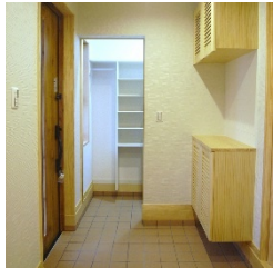
(左)玄関にはシューズクロークを設置 (右)キッチン横を通り2階へ。扉付 洗面室やお風呂への動線が近く便利