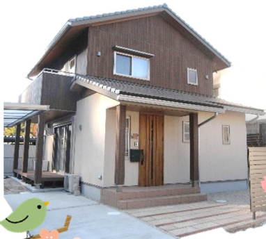
【豊田市中金町 N 様邸】 ブラウンとベージュの壁が優しい和モダン住宅