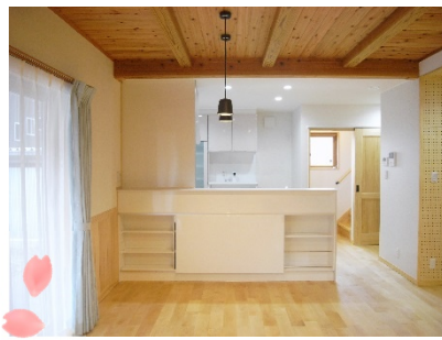
LDK床 パーチ(カバ)無垢板