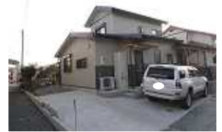
写真上: 工中外観 写真下: 完成時外観