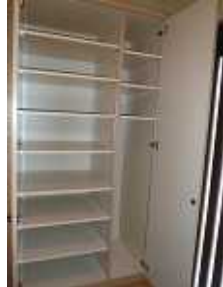
玄関の造り付け下駄箱 (右側扉オープン時)