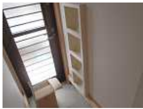
勝手口に壁面利用の下駄箱を