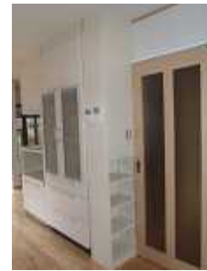
建具横に収納棚を