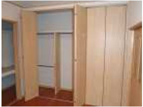
ハンガーパイプも二段にして スペースを有効に利用