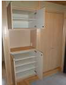
玄関の造り付け下駄箱 (左側扉オープン時)