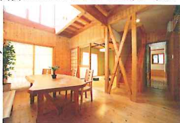
【マルスモデルハウス 床壁とも赤松】

一方、木に触れると「ホット」とするような温かみを感じるの、木には熱が伝わりにくい性質があり、触れても手の熱が木に奪われにくい、癒されるような温もりを感じるのです。