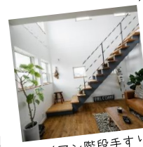
アイアン階段手すり