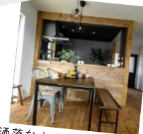
お洒落なキッチンカウンター