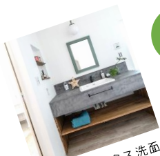
モールドックス洗面

大切な家族と暮らすお家で最も重要なこと それは「安全」であるということ そして快適であり省エネであることも 生活をする上ではとても大事な部分です 耐震性、耐久性、断熱性、省エネ性、 それらをすべて叶えながら ワクワクするようなお家時間を楽しむ それが、ライフフィールドがお届けする住宅です ぜひお気軽にお越しください ご予約お待ちしております