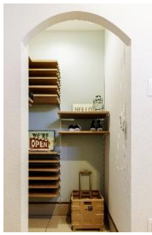
シューズクローク