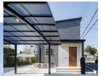
東側玄関 一部外壁を同柄色違いに変え アクセントに