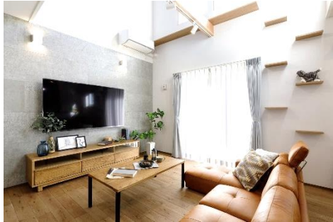
吹抜けを利用したキャットウォーク