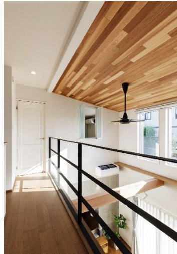
手すりはアイアンでお洒落に 吹抜天井の板張りとも相性◎