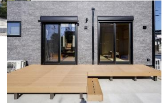
南側には広々ウッドデッキ