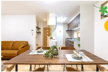
回遊できる間取りで行き止りをなくしました