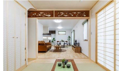
奥様の思い出のあるランマを リビングと和室の間にはめ込みました