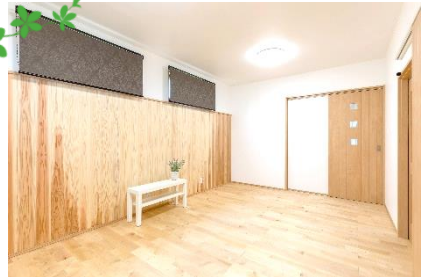
寝室の壁一面のみ杉板貼りでリラックス効果大