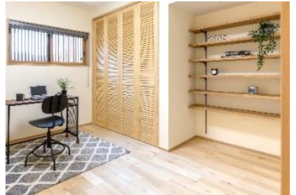
洋室の壁はしつくい塗 造り付けの棚で収納◎