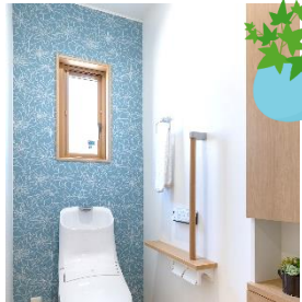
トイレ壁一面のみクロス変え 爽やかな空間になりました