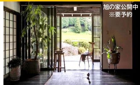
旭の家公開中 ※要予約