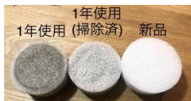
給気口フィルター汚れ具合