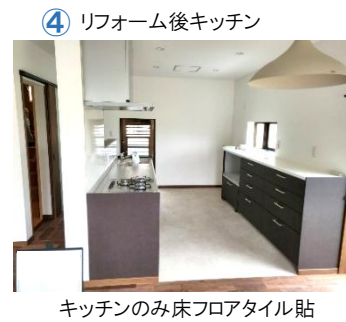
④ リフォーム後キッチン キッチンのみ床フロアタイル貼